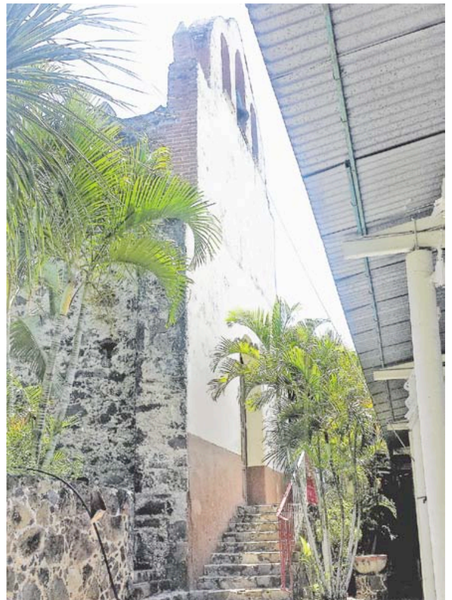
Capilla concluida