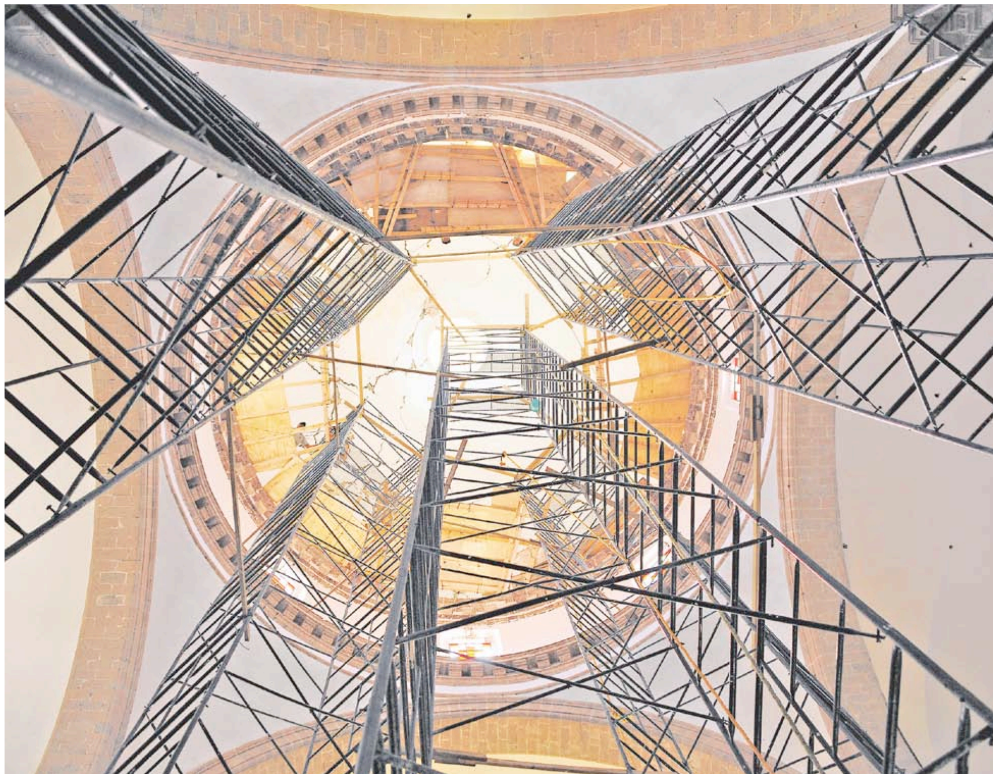
Templo de Nuestra Señora de Guadalupe, Cuernavaca/Mauricio Marat.