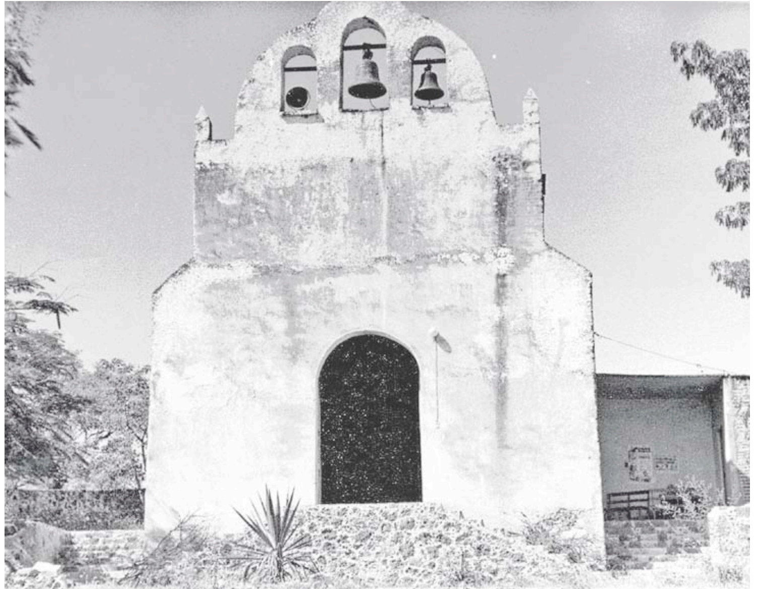
Capilla de Santa Cecilia. Ca. 1970

La capilla de Santa Cecilia, ubicada en el municipio de Emiliano Zapata, en la localidad de Tepetzingo, resultó con daño menor en el sismo del año pasado. En el acervo de la Fototeca "Juan Dubernard" se ubicó una pieza fotográfica de dicho inmueble que data de principios de 1970, como lo refiere al adverso de la imagen. En dicha toma se capturó de frente, lo cual el día de hoy no sería posible debido a la cubierta que se encuentra frente a ella. Tenemos esta comparativa y la lectura es que no se ha tenido alteración alguna, es decir: anexo de campanario, aplanado en ventanas, si comparamos con algunos inmuebles que si lo tienen actualmente. Como complemento, se anexa una foto del estado actual del inmueble, después de su restauración. Una vez más resaltamos la cualidad de la fotografía como registro a través del tiempo.